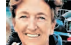
Liane Karlhofer design Textilien.